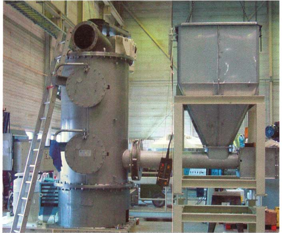
Afb. 1 Stoomdrooginstallatie

Het afvoeren van laagwaardige, natte stromen is vaak een onnodige kostenpost. Er bestaan immers economische droogtechnieken waarmee uit slurries of natte filterkoeken een waardevol, vast product is te winnen. Eén zo'n droogtechniek - vaak voorafgegaan door een mechanische ontwateringsstap - is stoomdrogen. Het stoomdroog-proces dat bij Hosokawa Micron BV is ontwikkeld, maakt gebruik van oververhitte stoom. Deze stoom wordt direct en intensief met het natte product gemengd, waarbij het water in het product wordt omgezet in stoom. De oververhitte stoom dient dus zowel voor de warmtetoevoer als voor het opnemen van het verdampte water. De droging gebeurt energetisch zeer efficiënt, zodat ook laagwaardige producten economisch kunnen worden gewonnen. Dankzij de snelle droging en de afwezigheid van zuurstof blijven nutriënten behouden. Bovendien wordt het product niet alleen gedroogd, maar ook gemalen, geclassificeerd en gesteriliseerd.